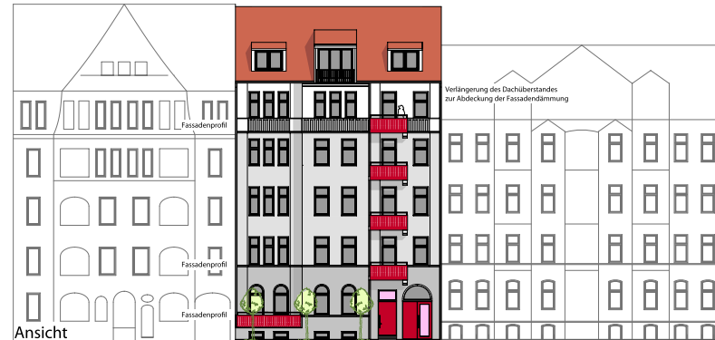
In den fünfziger Jahren saniertes Mehrfamilienhaus von 1906